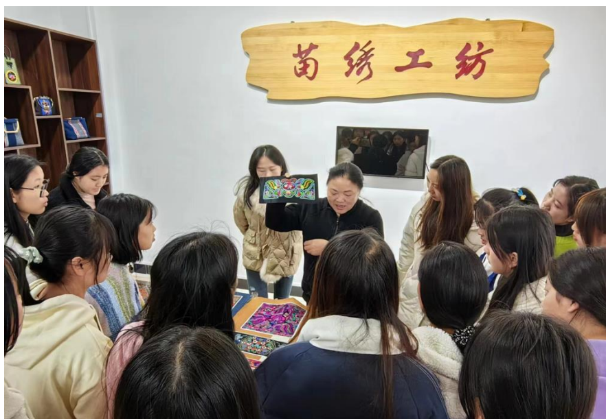
图 5-1 学院组织学生参观学习刺绣大师工作室

学院组织引导师生自觉传承红色基因、赓续红色血脉，以资源共享、形式多样、寓教于乐为整体思路，构建“红色铸魂 实践育人”模式，充分发挥红色文化教育作用，提高思政育人成效。形成党团组织“联手共育，齐争共创”的生动局面。学院秉承自身办学理念，始终以服务贵州制造业及服务业为己任，大力弘扬劳模精神和工匠精神，营造劳动光荣和爱岗敬业的良好风尚，不断深化教学改革，打造人才培养高地，把“专业知识扎实，技术能力突出，综合素质优良”作为人才培养的基本特色。致力于培养制造业及服务业技能技术人才。