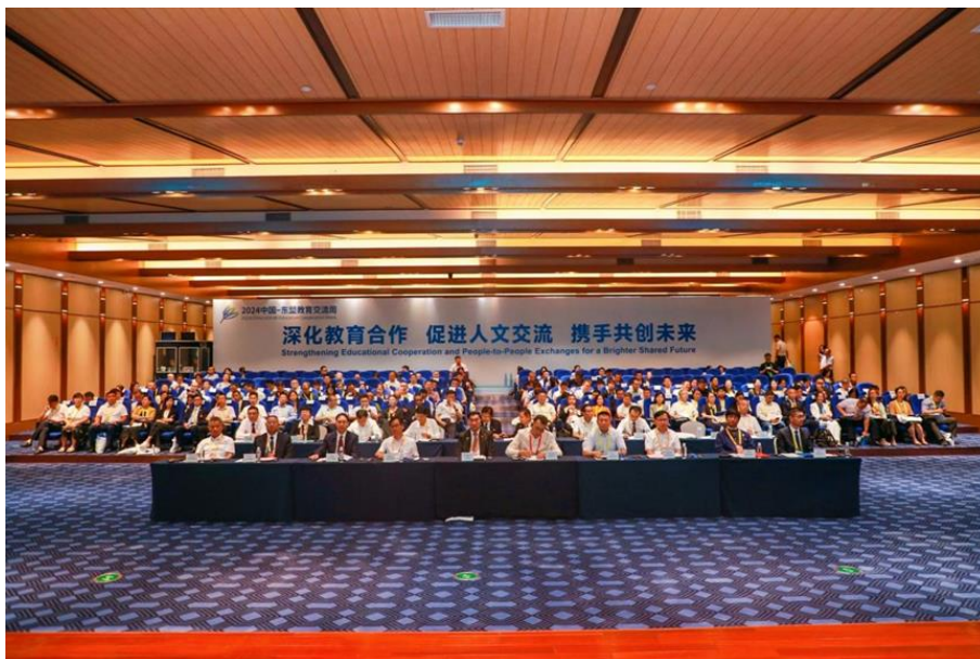
图 6-2 2024 年中国-东盟教育交流周项目活动现场