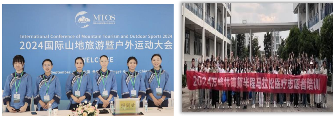
图 2-5 学院组织学生参加志愿者服务活动

学院树立“先锋力量”榜样，激发青年志愿服务精神。一是做好青年志愿者的培训工作。2024 年来邀请州内相关专家到校对志愿者开展了“心肺复苏紧急救援”、“礼仪接待知识”、“统计调查方法”等相关培训 19 场，覆盖学生 3995 人次，有效提高学院青年志愿者的能力水平。二是做好“西部计划”大学生志愿者的选拔工作。2024 年省项目办按方案分给学院 4 个省内服务名额，后经院团委向上协调争取又获得黑龙江省服务名额 4 个、吉林省服务名额 3 个共计 11 个西部计划大学生志愿者名额。三是积极服务万峰林景区创建及全州路跑产业，学院共组织青年志愿者 3995 人次到校外为第十八届贵州旅游产业发展大会、万峰林马拉松赛事等州里大型会议和活动开展志愿服务工作，获得服务单位一致好评。