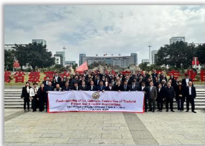
图 6-4 泰国易三仓学校联盟、欧美同学会、孔敬大学师生到校访问交流

学院积极搭建国际交流平台，围绕学院发展需求，学院与贵州轻工职业技术学院、贵州省教育国际交流协会、江苏电子信息职业学院、北京华晟经世信息技术股份有限公司于 2024 年 8 月 20 日自主承办 2024 中国—东盟教育交流周项目——“新时期国际产教融合促进职业教育高质量发展---第二届中国式现代化背景下的职业教育国际合作实践工坊”，为学院与东盟学院提供了合作交流的机会，吸引了老挝、泰国等国家的教育者积极参与，旨在教育合作方面加强中外高校合作交流，促进多方教育资源共享与优化；产学研合作方面推动产学研合作，促进科研成果转化与产业升级；人才培养方面培养更多符合行业需求的优秀人才，为经济社会发展提供人才支撑；文化交流方面加强中外文化交流，增进中外青年相互了解与友谊。