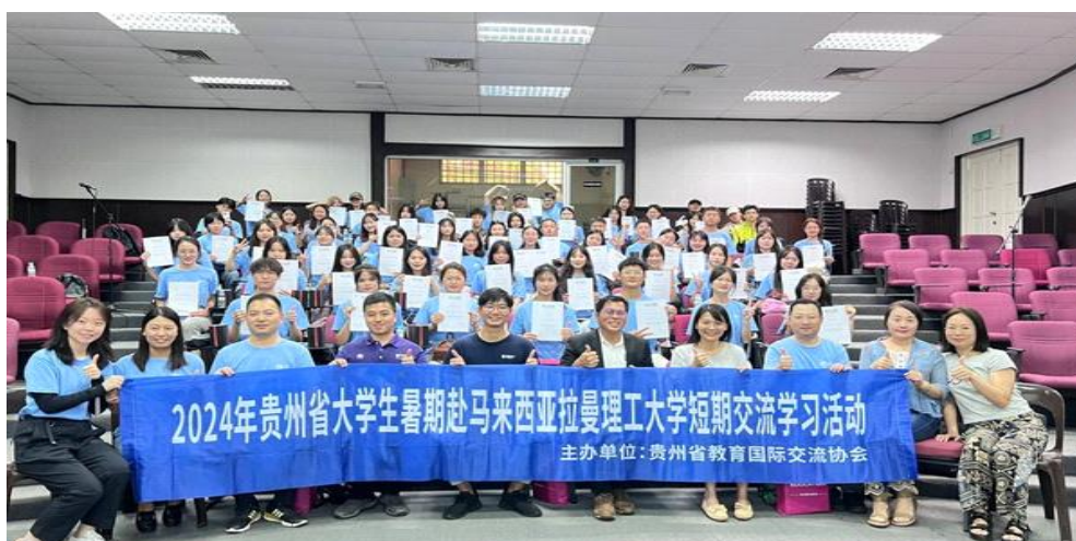
图 6-5 马来西亚拉曼理工大学海外游学项目