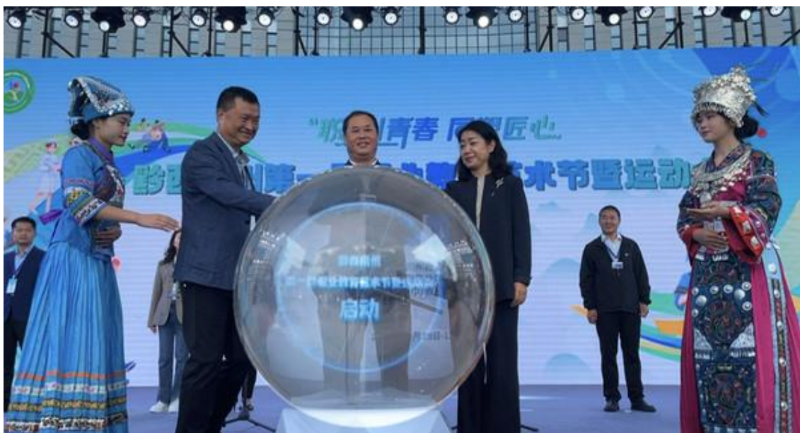
图 2-6 学院承办黔西南州第一届职业教育艺术节

学院以培养全面发展的时代新人为出发点，聚焦高质量人才培养，同区域经济社会发展需求相契合，针对德育、智育、体育、美育、劳动教育中的薄弱环节，精准施策，增强改革实效，把各项工作落实到提升育人成效上来，推动人才培养工作更加有效对接社会需求，不断提升育人质量。学院统筹校内外资源，整合学院各方资源，融合课程内容，加强德智体美劳教育内容的相互渗透与融合，推进课程教学、社会实践和校园文化建设深度融合，构建第一课堂与第二课堂相结合、课上与课下相结合、线上与线下相结合、校内与校外相结合、理论与实践相结合教育体系，激发内生动力，营造浓厚氛围，形成教育合力。