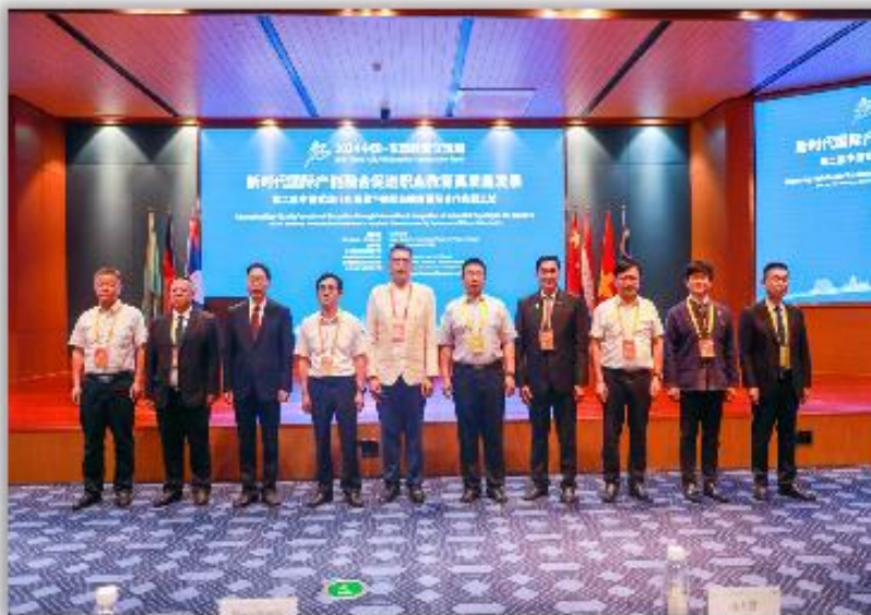
图 6-1 学院承办中国-东盟教育交流周活动

本学年，学院积极承办 2024 中国—东盟教育交流周项目“新时期国际产教融合促进职业教育高质量发展—第二届中国式现代化背景下的职业教育国际合作实践工坊”；承办 2024 年一带一路暨金砖国家技能发展与技术创新大赛之婴幼儿（0—1 岁）回应性照护赛项选拔赛（云贵赛区），在全国总决赛中获一等奖 5 项、二等奖 1 项。