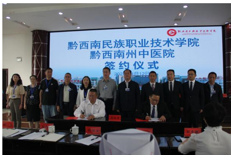
图 3-1 学院与黔西南州中医医院签约共育中医护理技能人才

2024 年 4 月 12 日，学院与黔西南州中医医院联合培养“护理（中医护理方向）”技能人才合作协议签约仪式圆满举行。本次签约既是双方深入贯彻落实科教兴国战略、健康中国战略、弘扬传承中医药文化、推进教育医疗协同发展的应尽之责，也是积极践行黔西南州“产业强州”“文教兴州”发展战略、多元化提升双方服务功能和质量、促进高校毕业生就业、保障人民身体健康的务实之举。根据协议，双方将围绕黔西南州中医药产业重点领域，在平台共建、学科建设、人才培养、科研合作、实习实训、信息交流等方面开展深层次合作，为深化中医药人才培养制度改革，全面加强中医药传承创新发展，促医疗服务水平提升、医疗健康人才培养、中医医疗技术创新和应用等积极提供案例和经验。