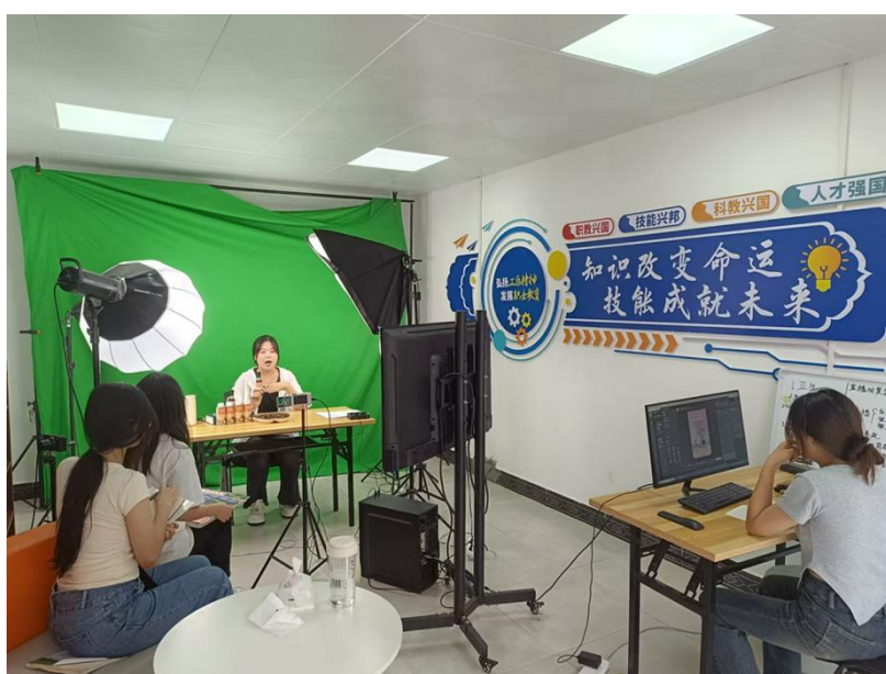
图 7-2 学院与贵州创壹管理品牌有限公司 JOJO 星球项目产教融合

其中天猫和小红书直播间以企业单品项目为主力点，通过运营定向人群从而让学生深刻理解互联网时代下定向人群的特点和相应的营销法则，三农抖音直播间为泛人群形式。通过泛人群和定向人群的不同形式的运营实践，培养学生从全局视角了解市场、了解人群，最终以达到其自身核心竞争力的提升。为更好模拟企业实际运营环境，激发学生活力，企业提取每月销售收入的 5% 作为学生直播团队的奖励；再提取每月销售收入的 5% 作为校方和企业的就业激励金。