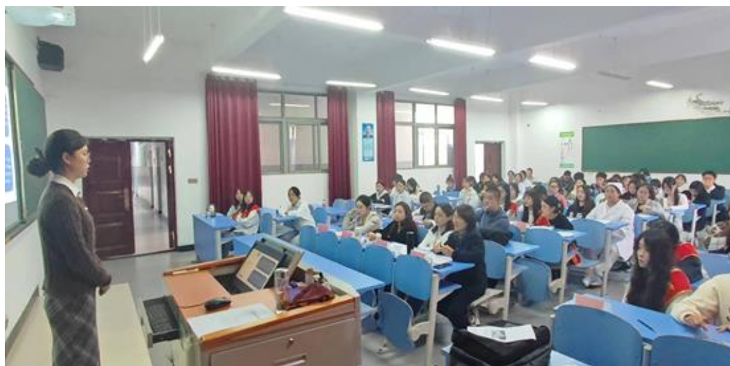
图 2-8 学院举办首届全国大学生职业规划大赛校赛决赛

最后，评委老师对参赛选手的积极参与和比赛表现给予充分肯定并进行颁奖，举办这次比赛目的是通过学生们在制作职业规划的过程中，了解自我，明析目标职业信息及自身的差距，激发学生们对护理职业的热爱与期盼，发展自我。