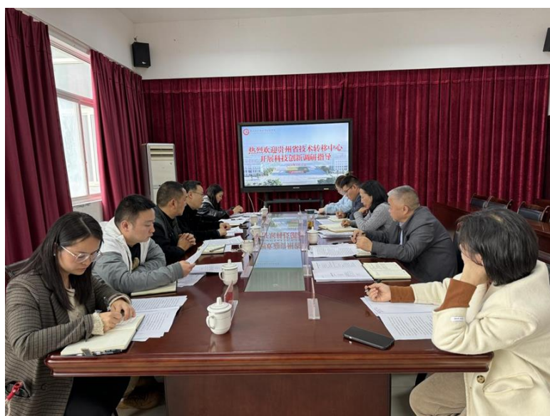
图 4-1 学院与黔西南州科技局共建地方技术转移中心

大学科技园于 2023 年 12 月与州科技局签订建设合同任务书，立项《黔西南州技术转移服务示范建设》项目，以地方科技平台项目形式共建设地方成果转化机构；2024 年 3 月 12 日贵州省技术转移中心到学院就黔西南州技术转移中心建设调研指导；2024 年 6 月 21 日贵州省教育厅科技处一行到学院大学科技园实地考察评估，胡锐处长等一行高度肯定大学科技园建设技术转移中心的发展定位。2024 年 8 月 29 日黔西南州科技局到学院调研技术转移线上平台的架构设计情况。