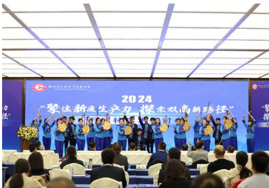
图 2-2 学院承办民族地区职业教育学术研讨会

学院不断加强党的建设和思想政治教育工作，并将其作为人才培养的出发点和立足点，努力树好党建育人“品牌”，团建育人“名片”、师德育人“标兵”，扎实推动学院党建引领与教育教学事业的深度融合与高质量发展。学院领导深刻认识到高质量党建对于未来发展的核心作用，提出“党建树立品牌、教学质量提升、科研成果丰硕、人才队伍壮大、干事激情高涨、社会评价溢出”六大核心目标，要求敏锐洞察新时代职业教育的发展机遇与挑战，通过“树职教思政品牌、立产教融合标杆、创文化育人典范、建科教融汇高地”，学院将深入实施“党建领校、质量强校、科研立校、文化兴校、成果惠校”的发展战略，落实“一体、两翼、三驱动、四平台、五导向、六品牌”的工作思路，全面推动学院在教学质量、科研创新、人才培养、师生风貌及社会评价等方面实现质的飞跃。