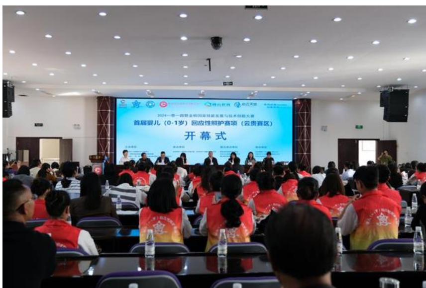
图 6-3 学院承办 2024 年一带一路暨金砖国家技能发展与技术创新大赛

学院与马来西亚拉曼理工大学、泰国东方皇家理工大学 2 所国外院校签署谅解备忘录（MOU），与马来西亚东姑阿都拉曼管理及工艺大学开展 1 次线上座谈。选派 10 名学生赴马来西亚拉曼理工大学进行交流学习，1 名学生参加 2024 贵州青年赴香港交流活动，1 名教师参加 2024 贵州省地方公派澳大利亚职业院校领导力提升研究项目。选派 15 名教师参加中国—