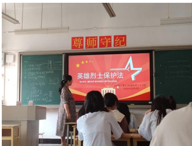
图 5-2 学院开展“传承红色基因”主题活动

2024 年 4 月 2 日，学院护理系党总支组织全体党员和入党积极分子到兴义市革命烈士陵园开展“缅怀革命先烈、弘扬先辈精神”的主题党日活动，重温中央红军长征在黔西南的红色历史，深切缅怀英雄烈士不朽功勋，大力弘扬英烈精神。2024 年 5 月 17 日，为庆祝 5.12 国际护士节，学院护理系党总支组织开展了以“滚烫青春 守护生命”为主题的文艺活动。