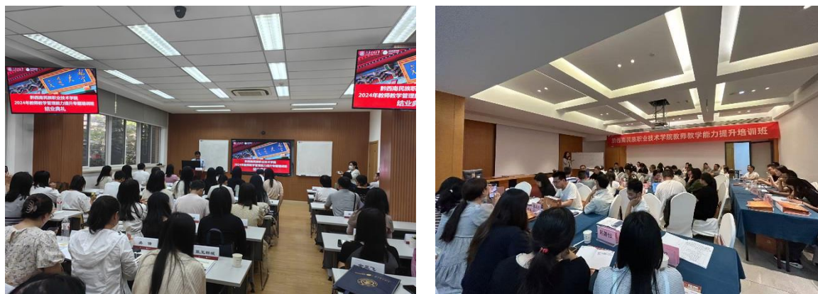
图 3-3 学院积极开展教师培训工作

学院现有“双师型”教师 411 人，其中院内“双师型”教师 265 人（初级 148 人，中级 72 人，高级 45 人），企业“双师型”教师 146 人，占专任教师比例为 83.54%。通过“请进来”“送出去”，与上海交通大学、同济大学等知名高校开展教师教学和管理能力、管理干部综合能力提升等培训 500 余人次。