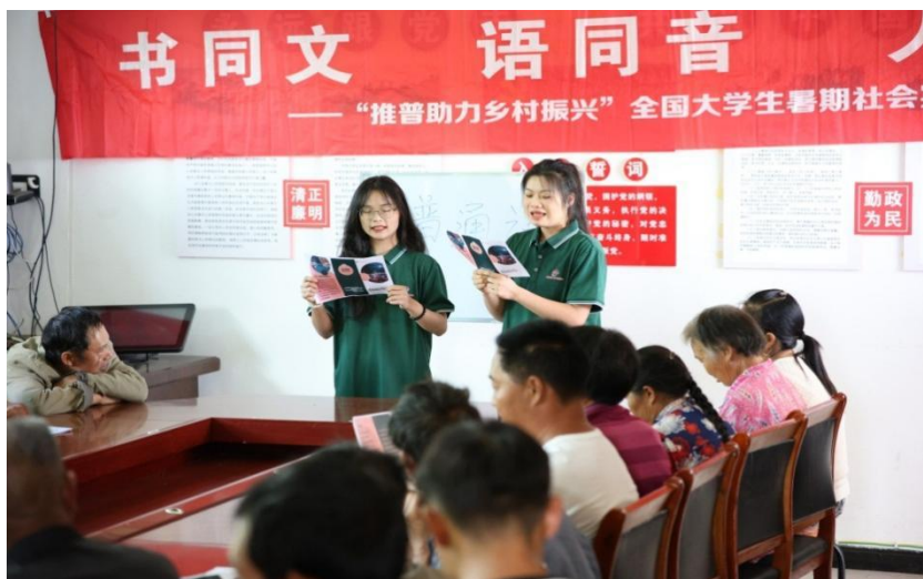
图 4-2 “推普助力乡村振兴”全国大学生暑期社会实践志愿服务活动