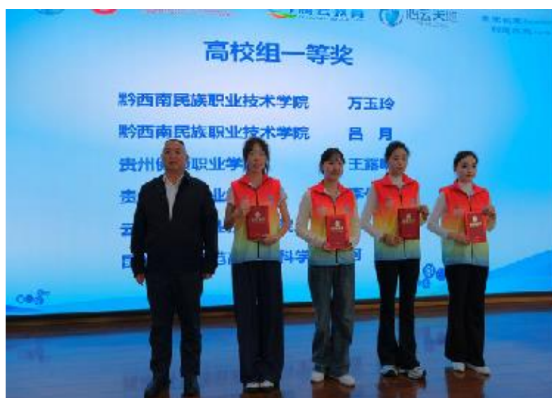
图 2-9 学院师生参加技能大赛荣获一等奖晋级国赛

项；第二届全国乡村振兴职业技能大赛贵州省选拔赛获优胜奖 2 项，二等奖 1 项；第七届全国高校大学生讲思政课公开展示活动获二等奖 1 项；贵州省第八届大学生讲思政课公开课展示活动获二等奖 1 项；第四届“外教社·词达人杯”全国大学生英语词汇能力大赛获一等奖 1 项，二等奖 1 项，三等奖 2 项；第二届全国高等医学院校大学生形态学读片和人体解剖标本辨识技能大赛获三等奖 1 项；第四届全国插花花艺行业职业技能竞赛（西南赛区）获三等奖 2 项。