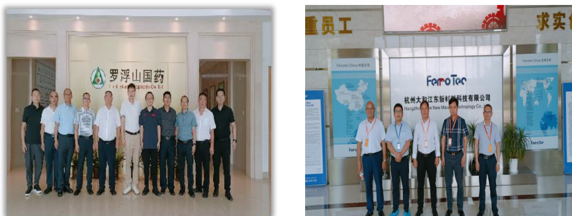
图 7-1 学院领导带队企业考察助推产教融合发展

产教融合、校企合作始终是职业教育改革中坚持的重要主线，新时代职业教育改革发展仍然聚焦产教融合、校企合作这一重点热点难点，力求突破，推进高质量的产教融合、校企合作，夯实企业在职业教育办学中的主体地位，实现校企“双元”育人，为新时代高职教育高质量发展赋能护航，是贯彻落实国家职业教育改革发展，实现高质量发展的重要举措。学院有多个专业采取和企业合作的方式，深化产教融合，校企双元育人。学院现有校企合作单位 121 家。