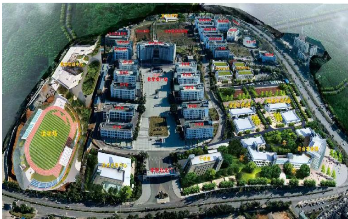
图 1-1 黔西南民族职业技术学院全景图

黔西南民族职业技术学院于 2004 年经省人民政府批准成立，由黔西南州原农业学校、水电学校、农机化学校、财贸学校、卫生学校合并组建，2008 年，黔西南民族行政管理学校并入学院。学院始终秉承育人初心，勇担职教使命，以“闯”的精神、“创”的劲头、“干”的作风，不断破解发展难题、增强发展动力、厚植发展优势，聚焦人才培养，累计为地方培养优秀人才 5 万余名，为黔西南地区经济社会飞速发展作出巨大贡献。