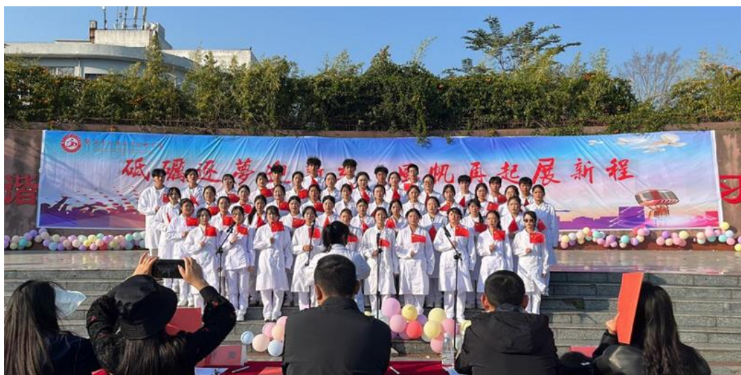
图 2-7 学院举办“砥砺前行迎新季 风帆再起展新程”迎新合唱比赛

为了丰富学院学生文化生活，活跃校园气氛，增强同学情谊，迎接新生的到来。歌唱是表达情感的极佳方式，护理系团总支于 11 月 26 日下午 3:00，在学生广场特组织系内在校学生开展“砥砺前行迎新季，风帆再起展新程”为主题的迎新合唱比赛。