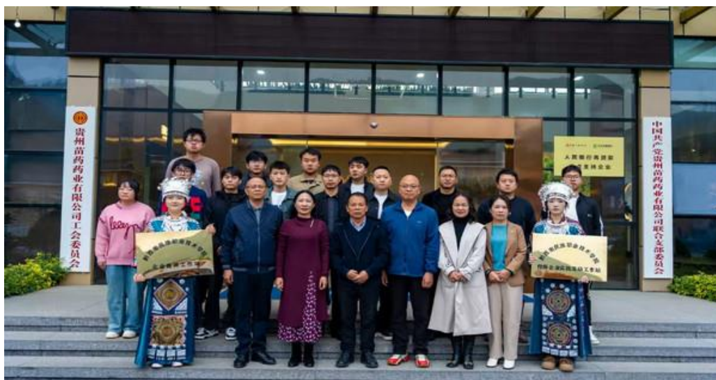
图 3-2 学院成立教师工作站推进师资队伍建设和

《关于 2024 年度教师假期实践进修申请工作的通知》，290 名教师申请开展企业实践，实践总时长达 657 个月。