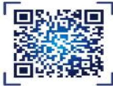
黔东南民族职业技术学院线上缴费操作流程

4. 书费 约600元/生/学期，入学后根据各专业教材使用情况，核定后交教材供应商。